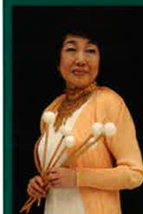
安倍圭子 Keiko Abe

日時 / 8月4日(火) 18:00 開場 18:30 開演 会場 / ヤマハホール 東京都中央区銀座 7-9-14 料金 / 3,000円(税込)・自由席 出演者 / 安倍圭子、ジャン・ジョフロイ マリンバコンクールで第一位を受賞した奏者たち 【チケットのお取り扱い】6/1(月)より発売予定 ヤマハ銀座店 4階 管弦打楽器売場 TEL:03-3572-3134 桐朋学園大学事務局教務課「マリンバアカデミー」係 TEL:03-3307-4113